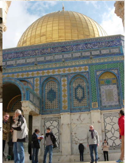
Felsendom in Jerusalem