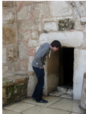
Der Eingang der Geburtskirche in Bethlehem.

Im Herbst, vom 7. - 15. Sept. 2012, soll die Reise stattfinden. Es ist ein großartiges Programm, das wir in diesen 9 Tagen vor uns haben. Mit Lufthansa fliegen wir nach Tel Aviv und werden dort von der israelischen Reiseleitung empfangen. Am ersten Besuchstag geht es am Meer entlang von Jaffo aus über Caesarea und Haifa nach Akko, der alten Kreuzfahrerstadt. Am nächsten Tag steht Nordgaliläa und die Heimat Jesu, Nazareth, auf dem Programm. Der nächste Tag ist dem See Genezareth und dem Jordantal gewidmet. Wenn möglich, übernachten wir in Bethlehem und besuchen am darauffolgenden Tag das heutige Bethlehem und die alte Patriarchenstadt Hebron.