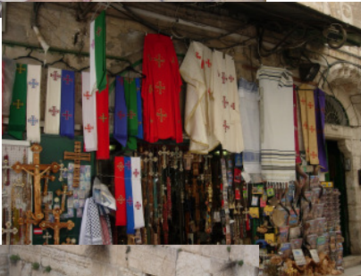
Via Dolorosa in Jerusalem