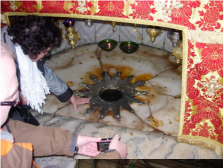
Bethlehem - in der Geburts- kirche