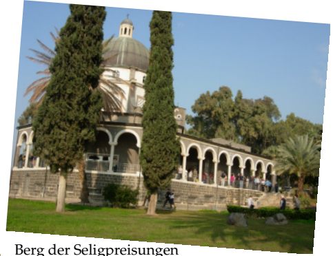
Berg der Seligpreisungen