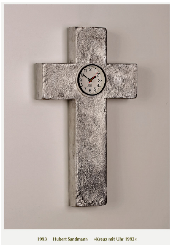
1993 Hubert Sandmann »Kreuz mit Uhr 1993«