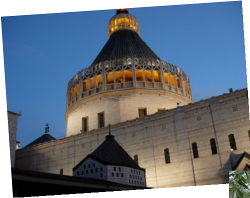
Verkündigungsbasilika in Nazareth