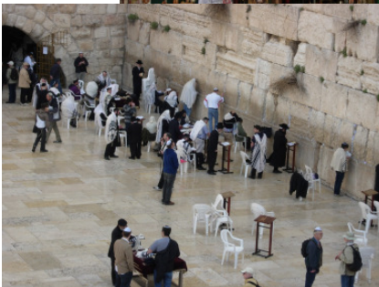
Westmauer in Jeru- salem, sog. Klage- mauer