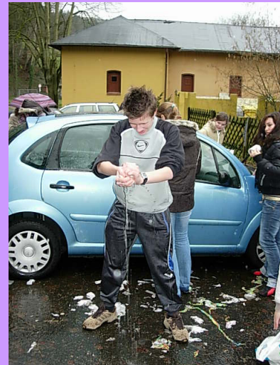
Aktion ‚Sauberes Pfarrerauto‘

Die zweite Gruppe , die wenige Wochen später nach Hohlenfels fuhr, legte dem Pfarrer Handkäs ins Auto, der dort die ganze Zeit über ‚reifte‘. Beim Losfahren, als der Pfarrer wegen der Kälte auch noch die Heizung aufdrehte, fing er so richtig an, ordentlich zu stin... und war noch wochenlang zu riechen.